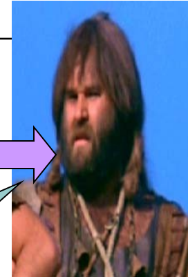
Godmar il Potente Barbaro cacciatore