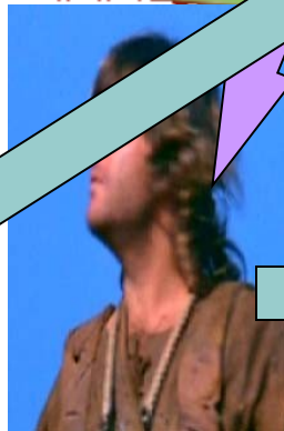
Maurino Barbaro petulante