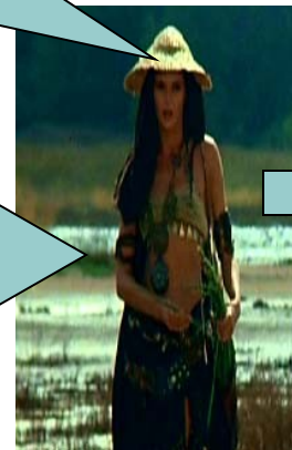
Moglie di Puntario