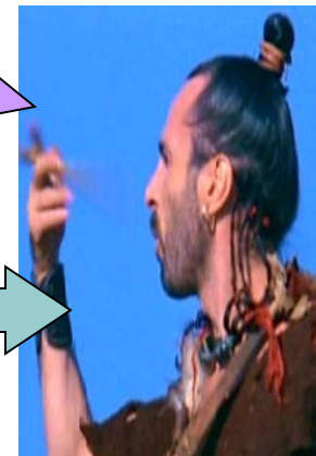
Giallo Barbaro batterista