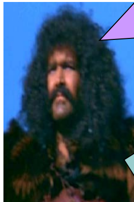
Attila Re dei barbari