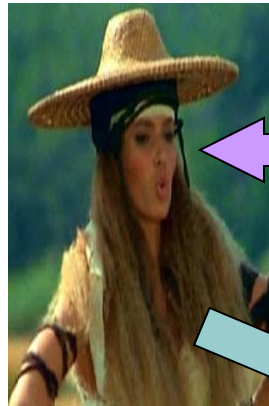
Uraia Moglie di Attila