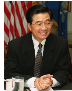
Hu Jintao (1942, Presidente, Segretario PCC)