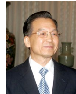
Wen Jiabao (1942, Capo esecutivo)